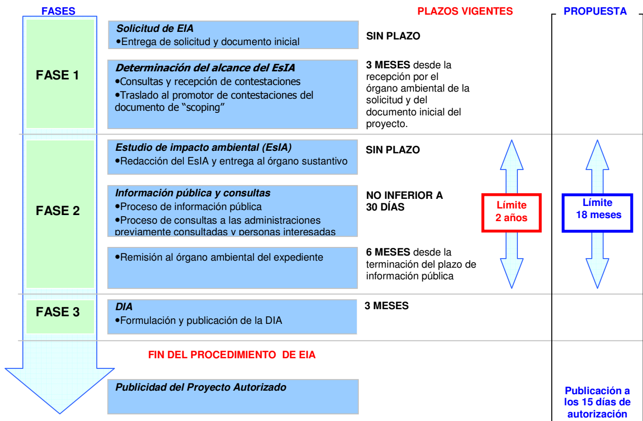
Gráfico 1. Delimitación de fases y modificación de plazos en la EIA